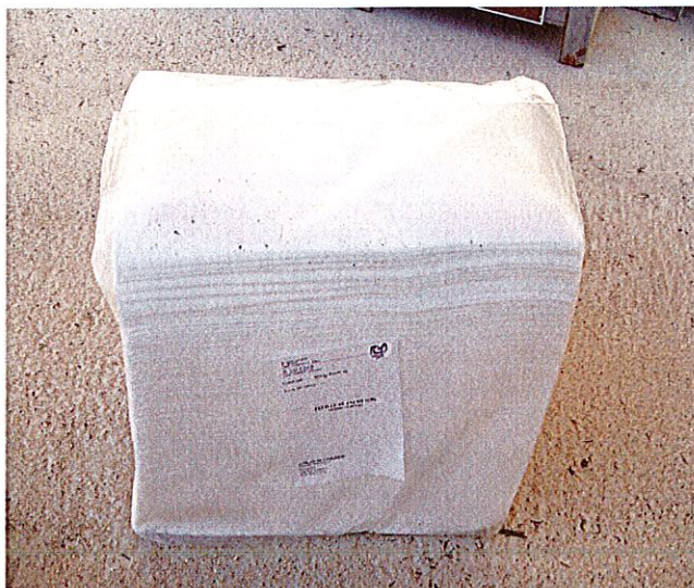
Sac de 200 feuilles absorbantes