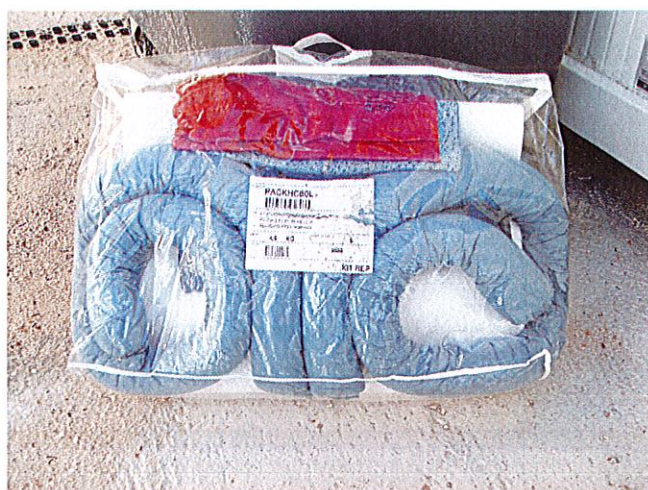
Kit antipollution capacité absorbante 60 litres

Une partie de ces matériels est immédiatement disponible sur le quai pour plus de rapidité et d'efficacité dans les interventions :